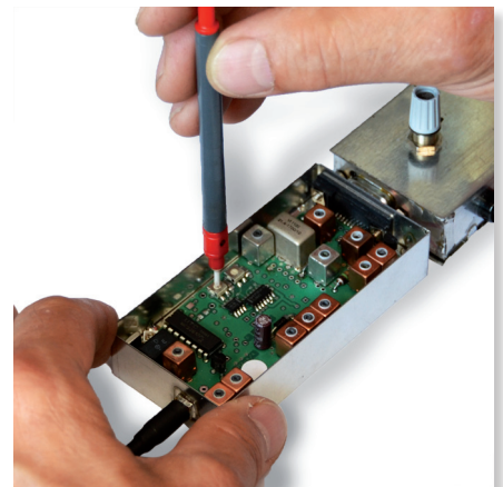
Fig. 2: Test du matériel comme spécifié par le client